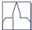
St. Maria unter dem Kreuze, Unterrath