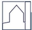
St. Bruno, Unterrath