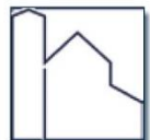
St. Maria Himmelfahrt, Lohausen