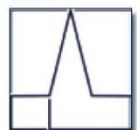
St. Maria Königin, Lichtenbroich