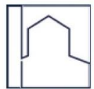
St. Albertus Magnus, Golzheim