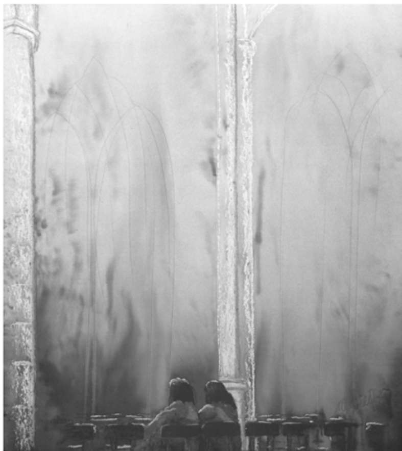
Bild: spirituelle Kunst von Michael Willfort, Galerie: www.kunst2day.de

Wo es finster bestellt ist in uns selbst, in der Kirche und in dieser Welt, sehnen wir uns nach dem Licht. Wo alles verhärtet ist in Hass und Kälte, sehnen wir uns nach Liebe und Wärme. Wir brauchen Gottes Geist in uns selbst, in der Kirche, in der Welt. Wir brauchen Pfingsten.